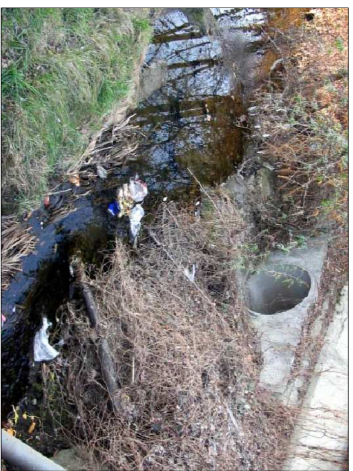
PANORAMICA ROGGIA LAMBRO DEL MOLINELLO