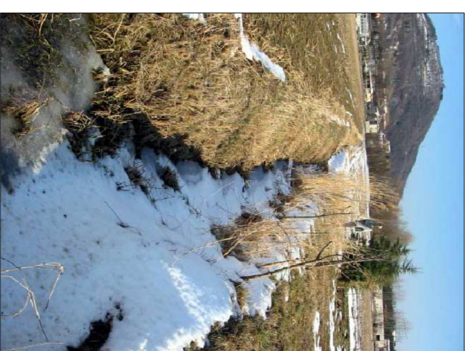
PANORAMICA CANALI AGRICOLI