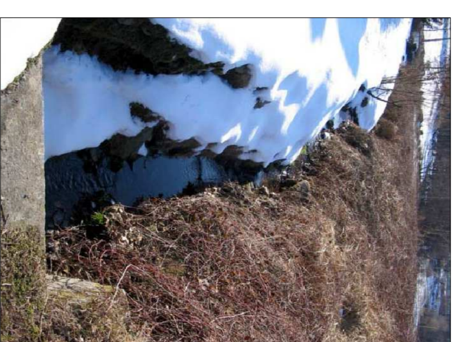
PANORAMICA TORRENTE 7 LOCALITÀ BEVERA INFERIORE